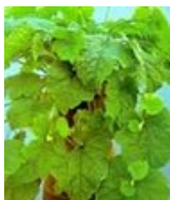
Henne mit Küken